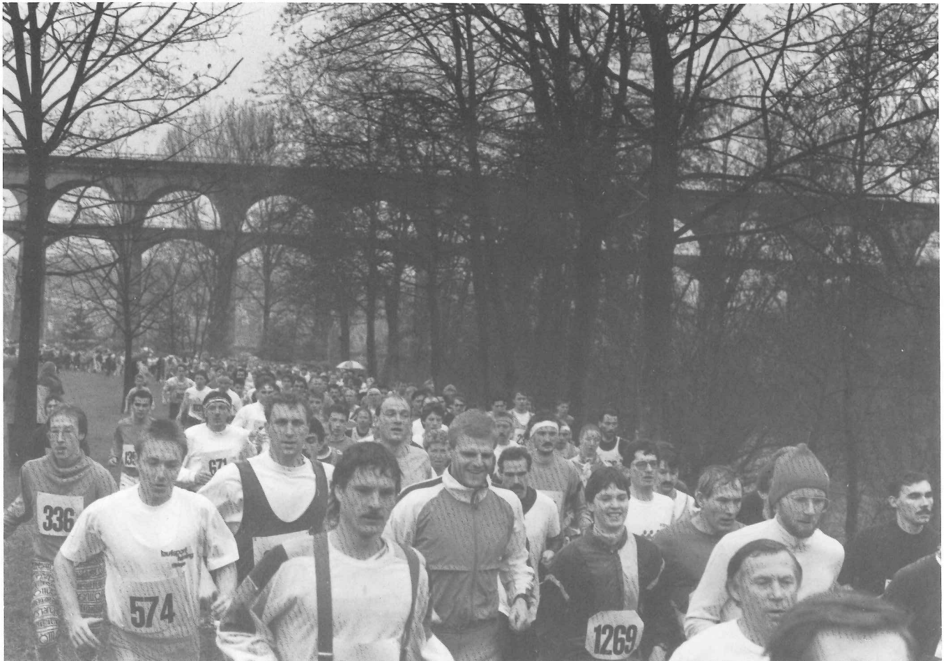
Ein Ausschnitt von den rund 1300 Teilnehmern, 1225 kamen auch ins Ziel.