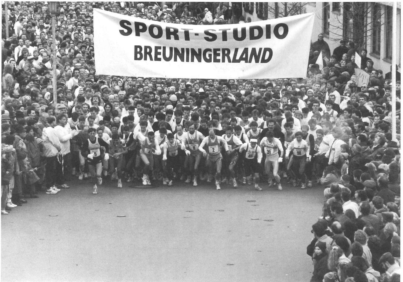
Weit über 1300 Teilnehmer waren in diesem Jahr am Start.